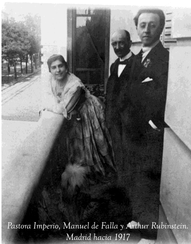
Pastora Imperio, Manuel de Falla y Arthur Rubinstein. Madrid hacia 1917

(del 21 diciembre de 2025 al 11 de enero de 2026)