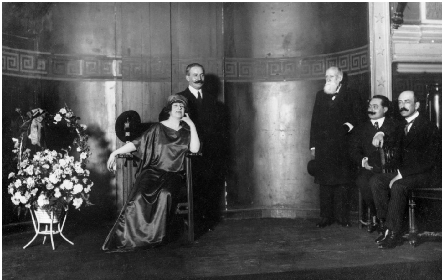
Miguel Salvador y Manuel de Falla (juntos a la derecha) y Georgette Leblanc Maeterlink con otras dos personas no identificadas, en el Ateneo de Madrid, durante el homenaje celebrado en honor de Falla y Turina, el 15 de enero de 1915.